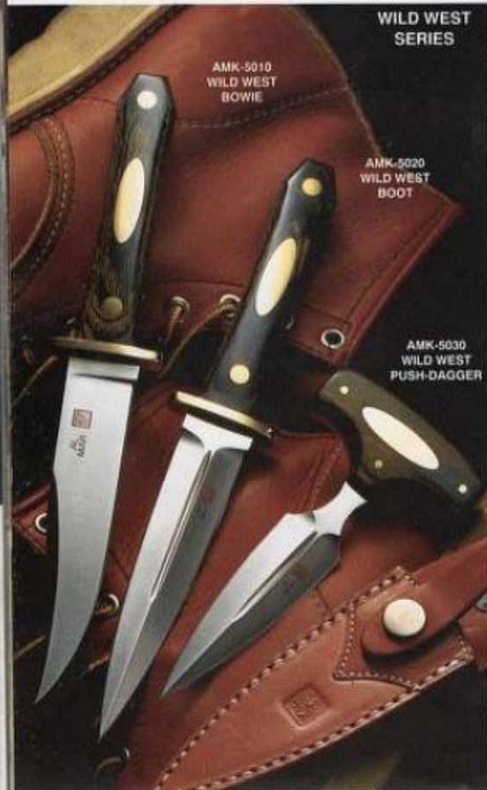
WILD WEST SERIES