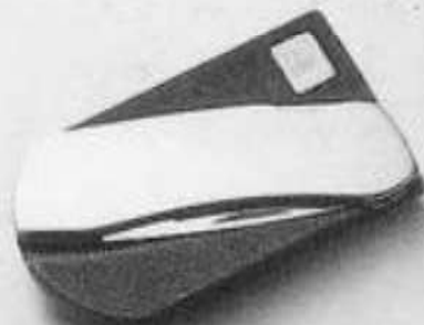
7002/SS BELT BUCKLE