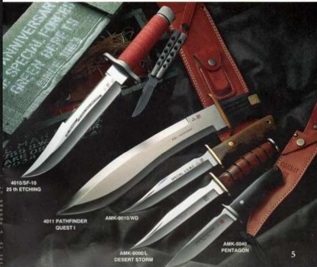
4010/SF-10 25th ETCHING