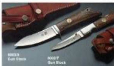
88833 Gun Stock

Les deux couteaux ont une lame semi-à-crochet de haut degré de durabilité en acier 440 C. Le manche en acacia PAKKA renforcé à la coupe est fait de cuir. Le côté d'une véritable carabine, qui s'y trouve incrusté, est encore à son charme. C'est une belle pièce, très efficace pour son usage.