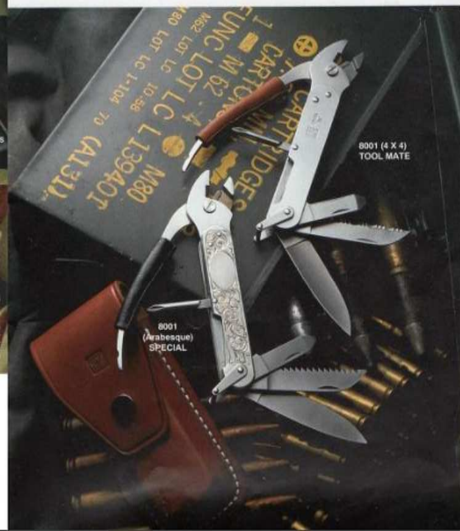
8001 (4 X 4) TOOL MATE

These knives, reference EOD KNIFE (EOD - Bomb Disposal Teams) have actually been used by the SWAT Bomb Disposal Teams. The designers of this knife have increased the many functional even the toughest handling. These pliers can also be used for cutting electric lines or wires. The end of the screwdriver is bevelled and can be used for scraping. The EOD knife also has a cruciform, a saw-blade and blades for classic usages. The knife was created with the military in mind. However, any one enjoying motorcycle or 4 wheel drive expeditions, fishing, camping and who have found themselves in need of a pair of pliers, will certainly appreciate it. These multi-purpose knives are real gems, and should always be carried as a pocket tool.