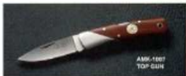
AMK-1007 TOP GUN