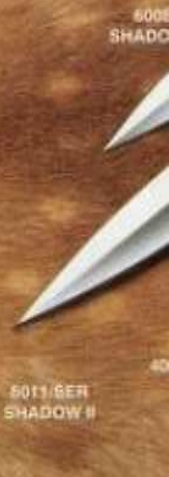
5011 BER SHADOW II